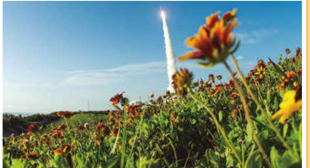
ESPAÇO - Lançamento do foguete Atlas V com o veículo Mars 2020 Perseverance Eda NASA a bordo