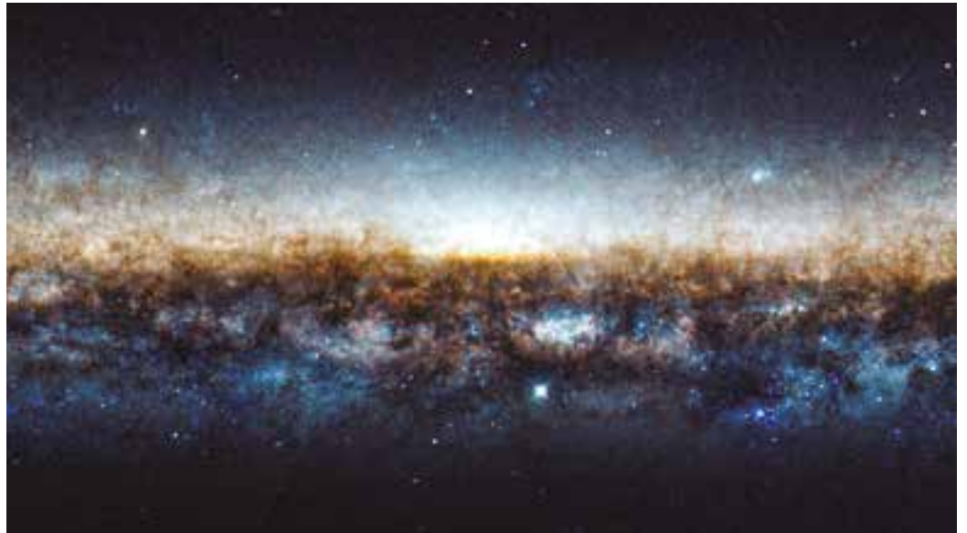
NASA - Telescópio Hubble captura o Galaxy on Edge que se estende por toda essa imagem