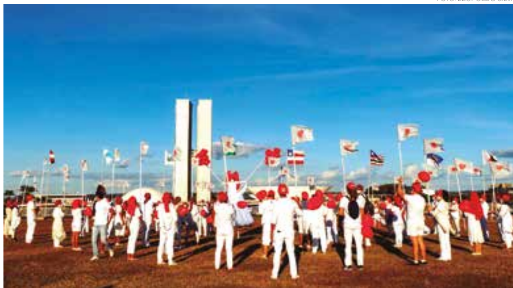
MANIFESTAÇÃO - Vestidos de branco, com máscaras e balões vermelhos, artistas fazem homenagem aos mortos pela covid-19