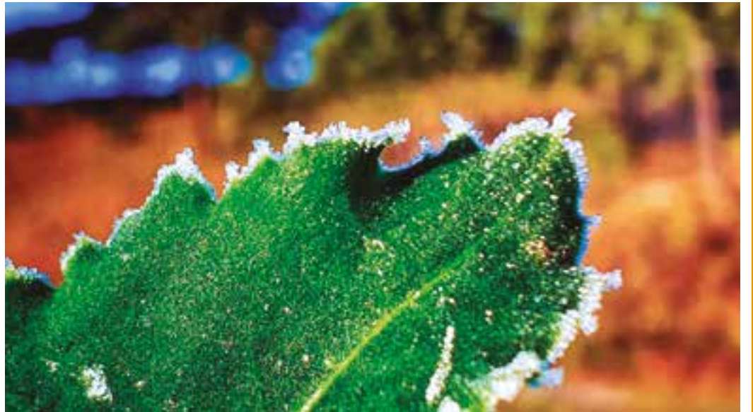
FRIO - Forte geada cobriu os automóveis, a vegetação no campo e até mesmo o telhado das casas na Serra Catarinense