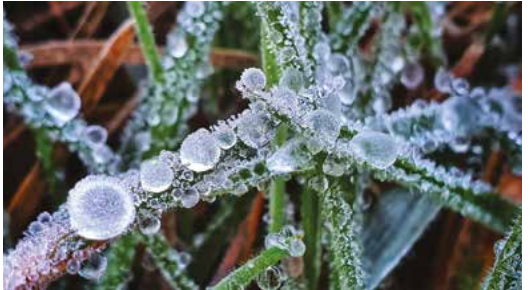
FRIO - Forte geada cobriu os automóveis, a vegetação no campo e até mesmo o telhado das casas na Serra Catarinense