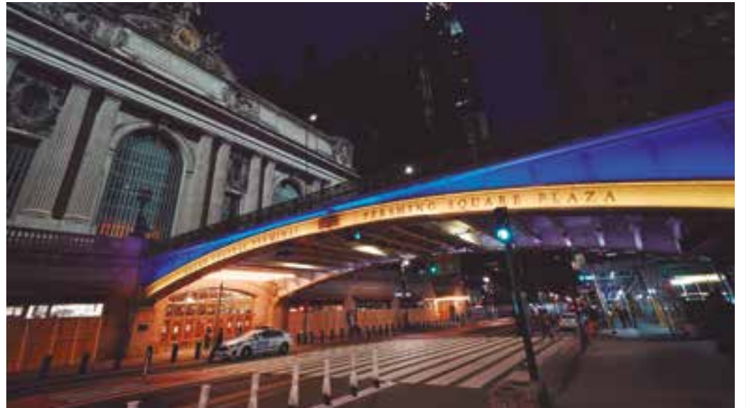
NY - Marcos do Estado iluminaram Blue e Gold em homenagem ao trabalho dos nova-iorquinos para aplinar a curva do covid-19