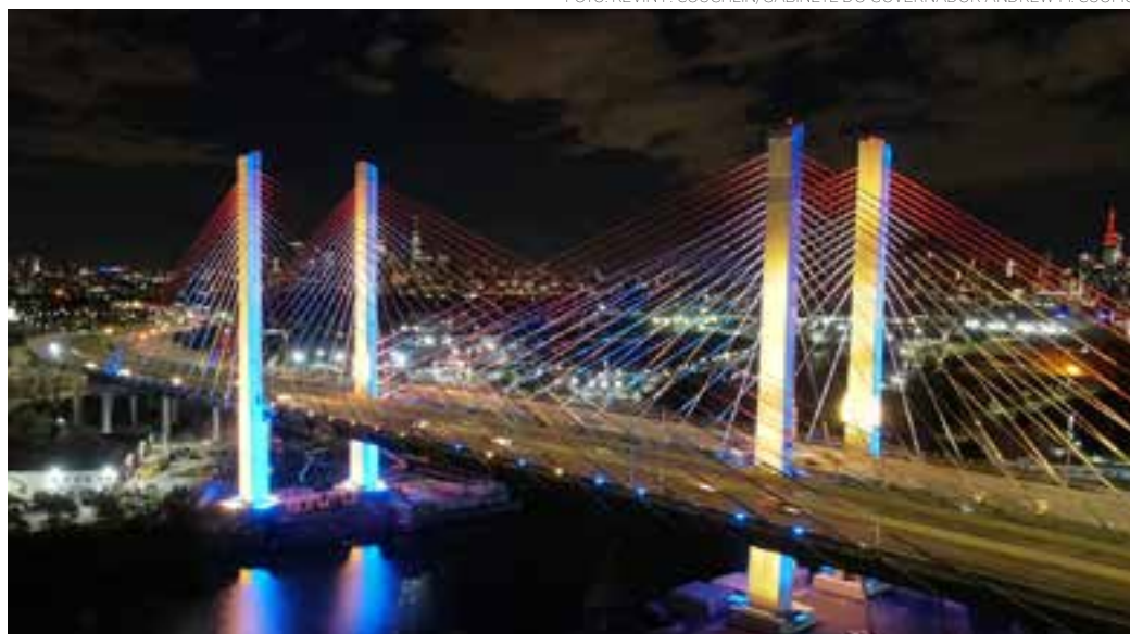
NY - Marcos do Estado iluminaram Blue e Gold em homenagem ao trabalho dos nova-iorquinos para aplinar a curva do covid-19