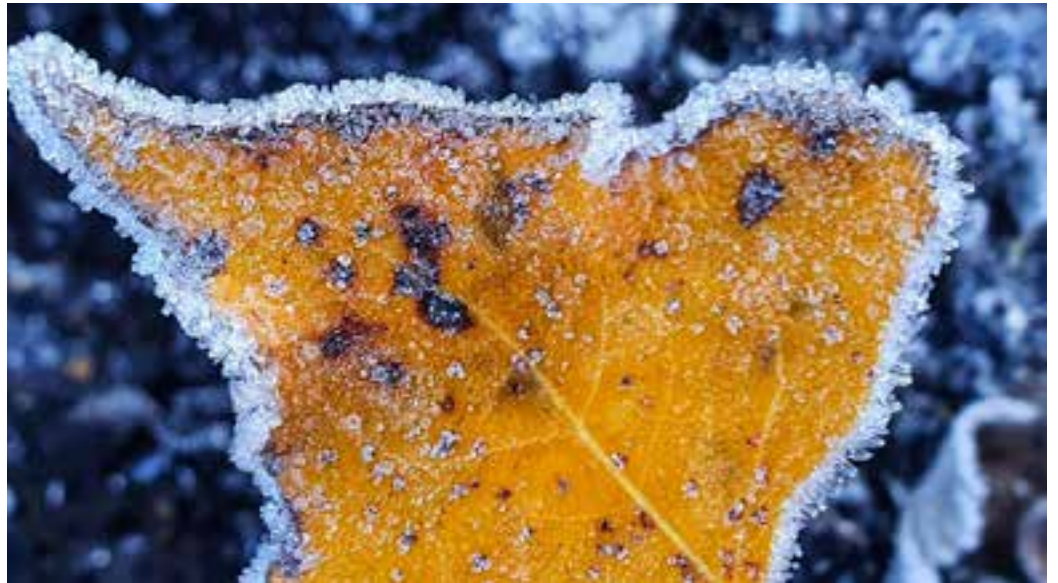
FRIO - Forte geada cobriu os automóveis, a vegetação no campo e até mesmo o telhado das casas na Serra Catarinense