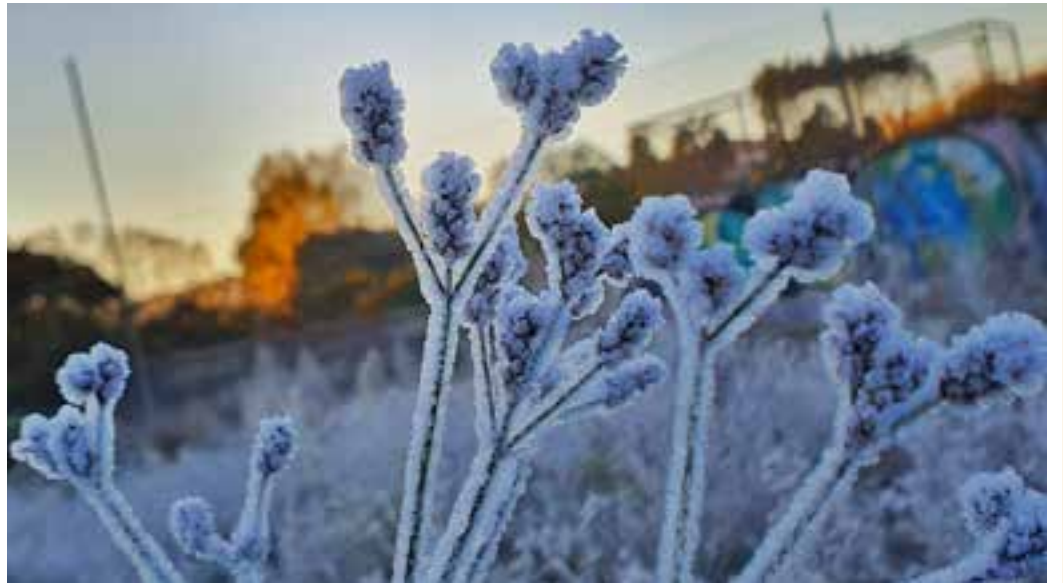
FRIO - Forte geada cobriu os automóveis, a vegetação no campo e até mesmo o telhado das casas na Serra Catarinense