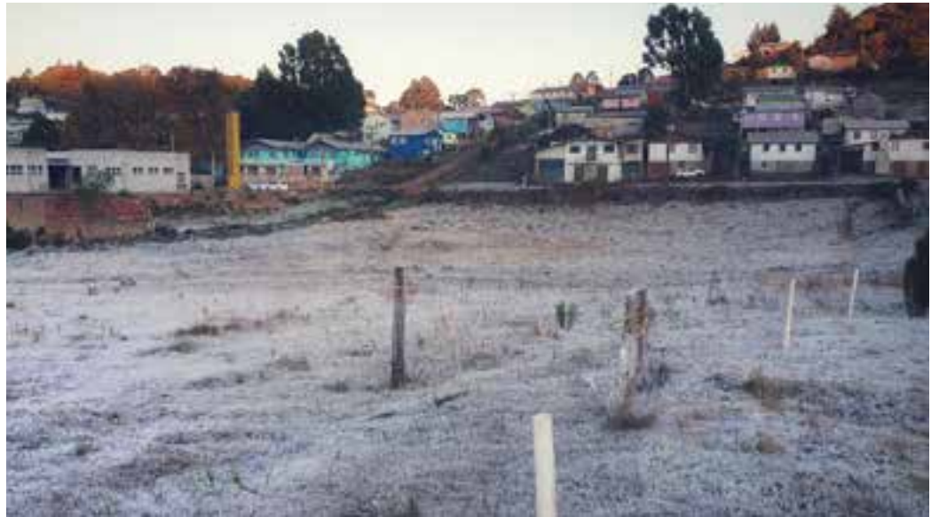
FRIO - Forte geada cobriu os automóveis, a vegetação no campo e até mesmo o telhado das casas na Serra Catarinense