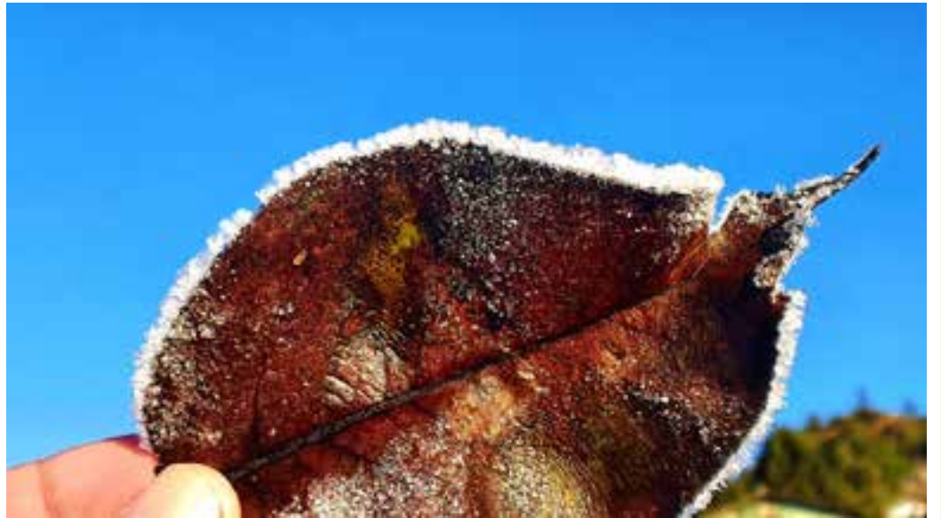
FRIO - Forte geada cobriu os automóveis, a vegetação no campo e até mesmo o telhado das casas na Serra Catarinense