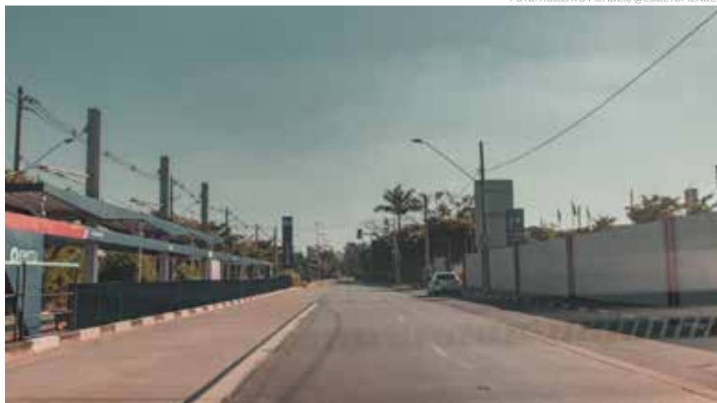
CORONAVÍRUS - Em meio a pandemia que vivemos, Guarulhos segue o isolamento social e registra ruas vazias