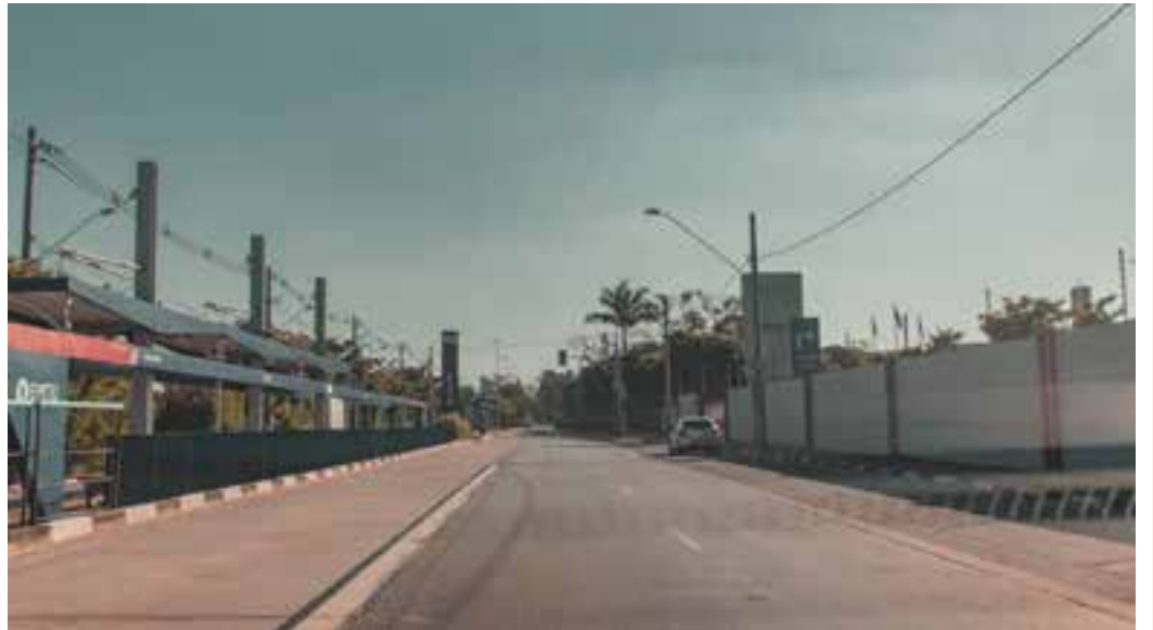
CORONAVÍRUS - Em meio a pandemia que vivemos, Guarulhos segue o isolamento social e registra ruas vazias