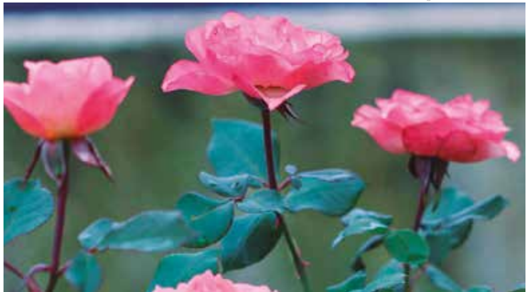
CORES - E o colorido e perfume das flores seguem com destaque em meio ao cinza das cidades