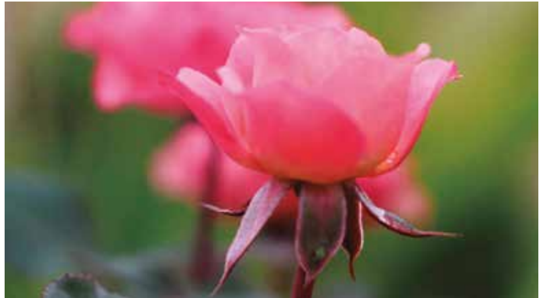
CORES - E o colorido e perfume das flores seguem com destaque em meio ao cinza das cidades