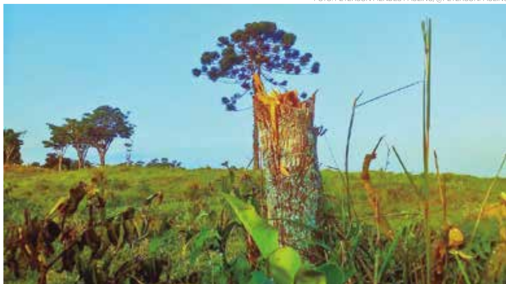
NATUREZA - E enquanto houver raiz haverá a esperança do reflorescer na próxima primavera