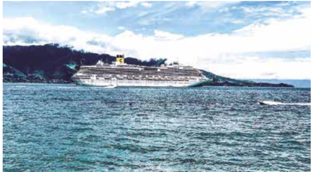
VERÃO - E o verão está indo embora neste mês que registrou poucos dias de calor e muita chuva