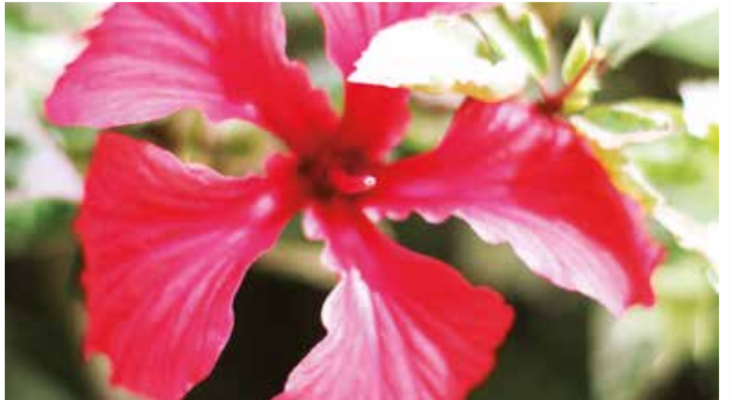
CORES - E o colorido e perfume das flores seguem com destaque em meio ao cinza das cidades