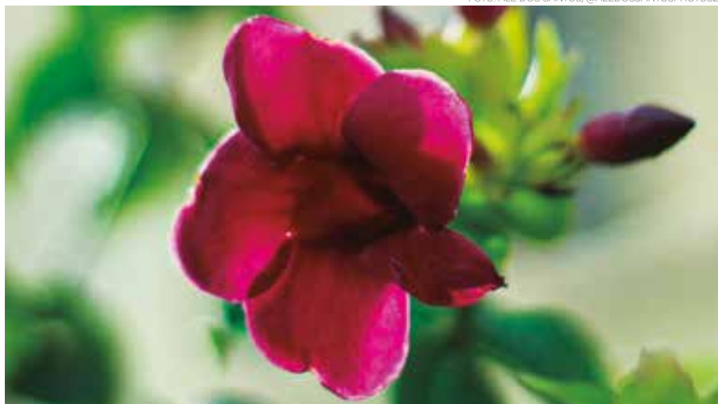
CORES - E o colorido e perfume das flores seguem com destaque em meio ao cinza das cidades