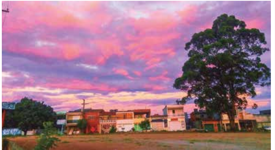
TEMPO - O fim de tarde tem sido uma incerteza durante o verão que, com as altas temperaturas, traz também as chuvas