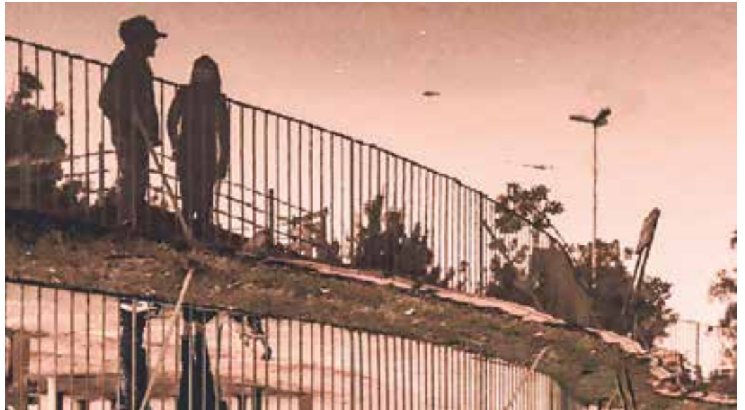
VISTA - Os inusitados encontros e reencontros que as cidades proporcionam em todos os lugares