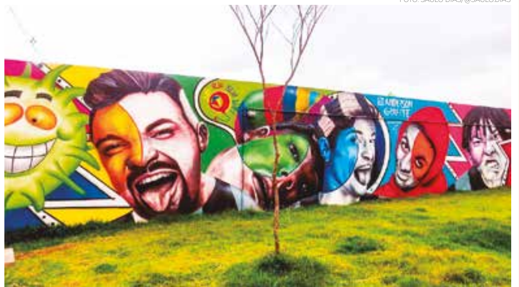
BRASÍLIA AMARELA - A arte homenageando os Mamonas Assassinas que levaram o nome de Guarulhos para além do aeroporto