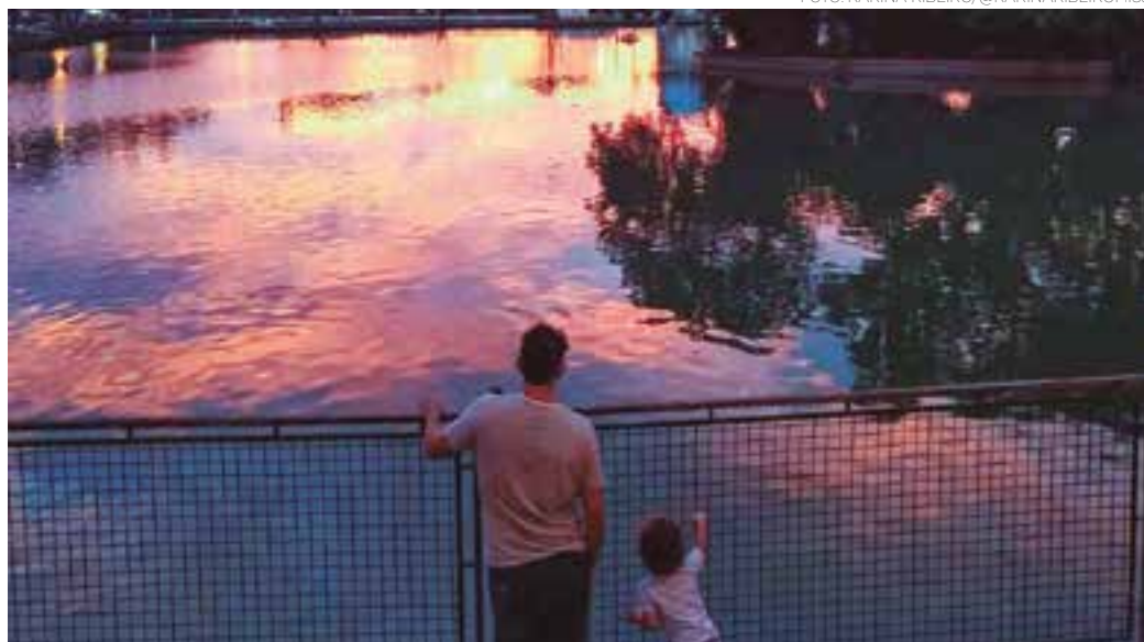
GUARULHOS - Vista do Lago dos Patos, um dos mais importantes pontos turísticos do município