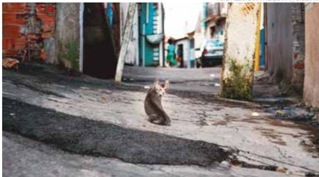
ANIMAIS - Cada vez mais cães e gatos fazem parte das famílias e compõem as cidades