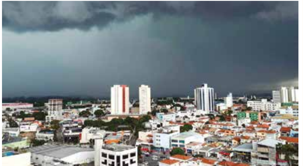
VERÃO - E o cinza no céu anuncia que as chuvas de verão chegaram para refrescar o calor