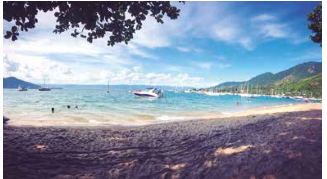
LAZER - E nas férias as praias são as melhores opções para relaxar e descansar da rotina das cidades