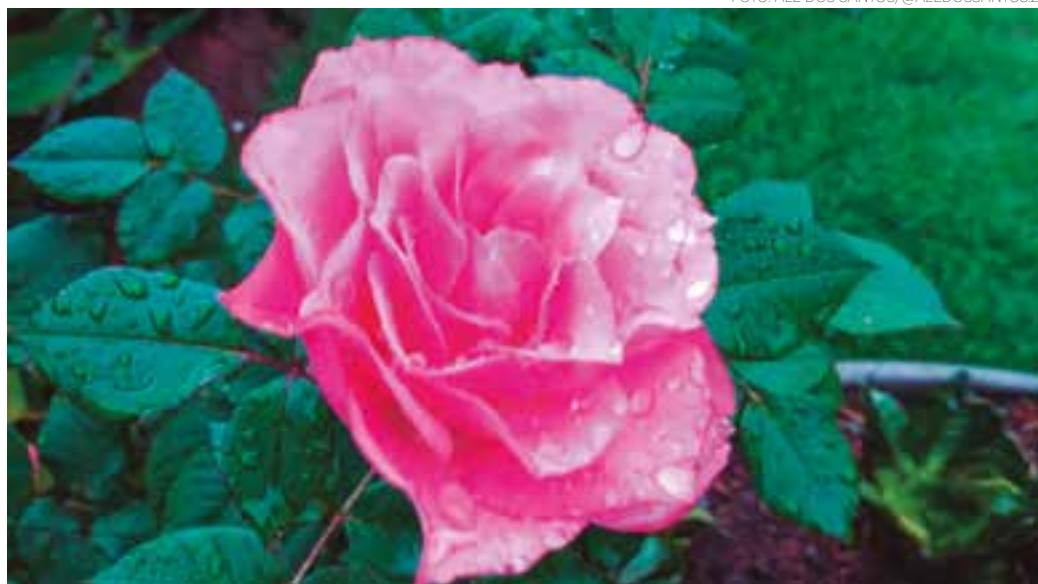
ESTAÇÕES - As cores e belezas da natureza estão presentes nas singularidades das flores em todas as épocas do ano