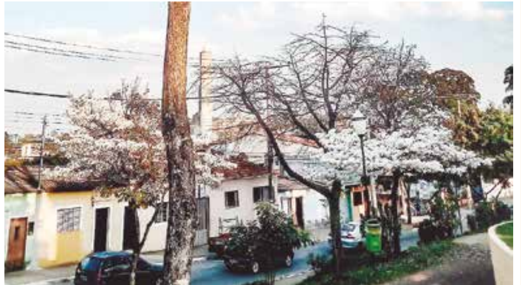
NATUREZA - Os contrastes das belezas e cores naturais em meio ao cinza das construções nas cidades