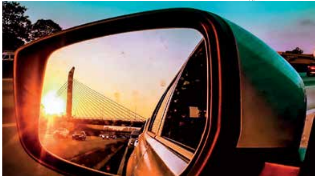
CIDADE - Guarulhos é um dos municípios mais acolhedores por onde uma infinidade de pessoas passam diariamente