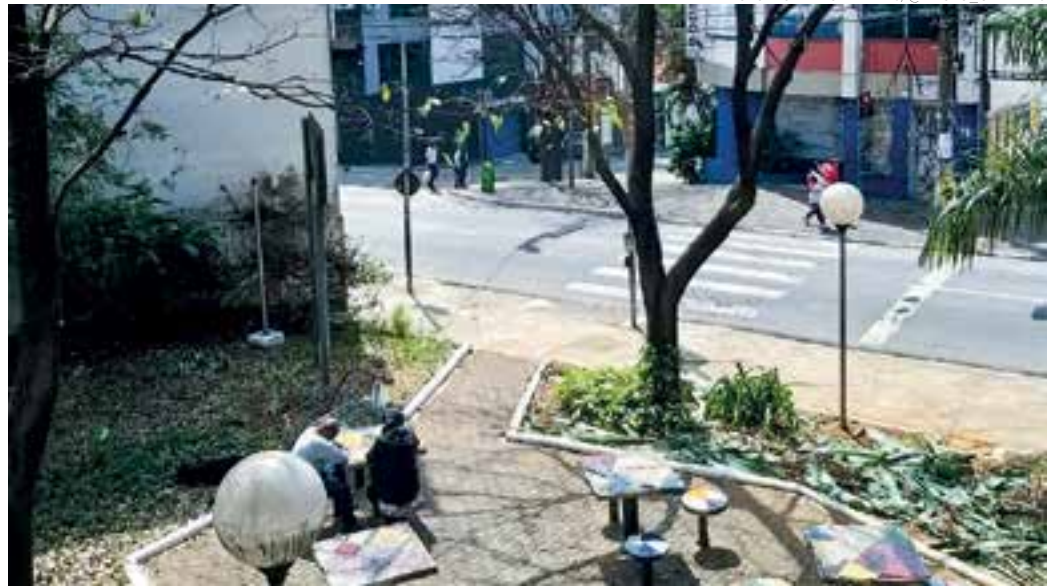
CIDADE - Os contrastes das cores da natureza em meio ao cinza das construções das cidades