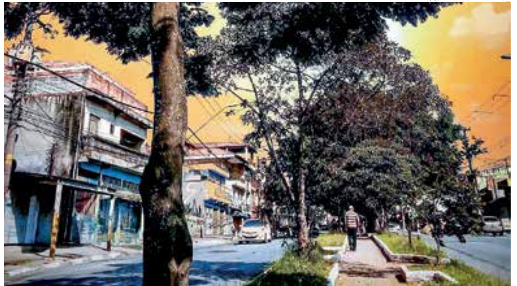
DIA - O entardecer na região da Ponte Alta com os guarulhenses encerrando mais um dia de trabalho