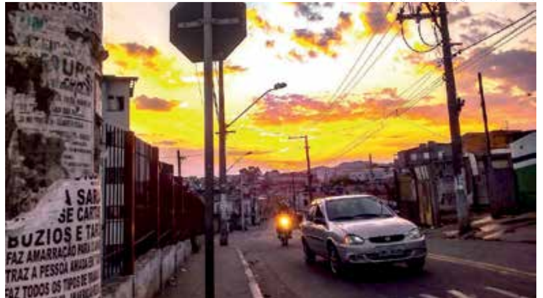
DIA - O entardecer na região da Ponte Alta com os guarulhenses encerrando mais um dia de trabalho