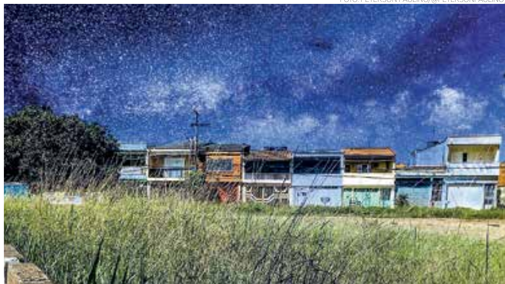
CÉU - Os contrastes no céu na região da Ponte Alta revelam as belezas do universo