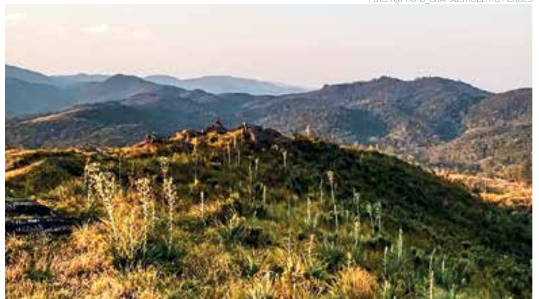
PAISAGEM - Vista do Mirante do Nhangucu, na região do Água Azul, que é um dos pontos mais altos de Guarulhos