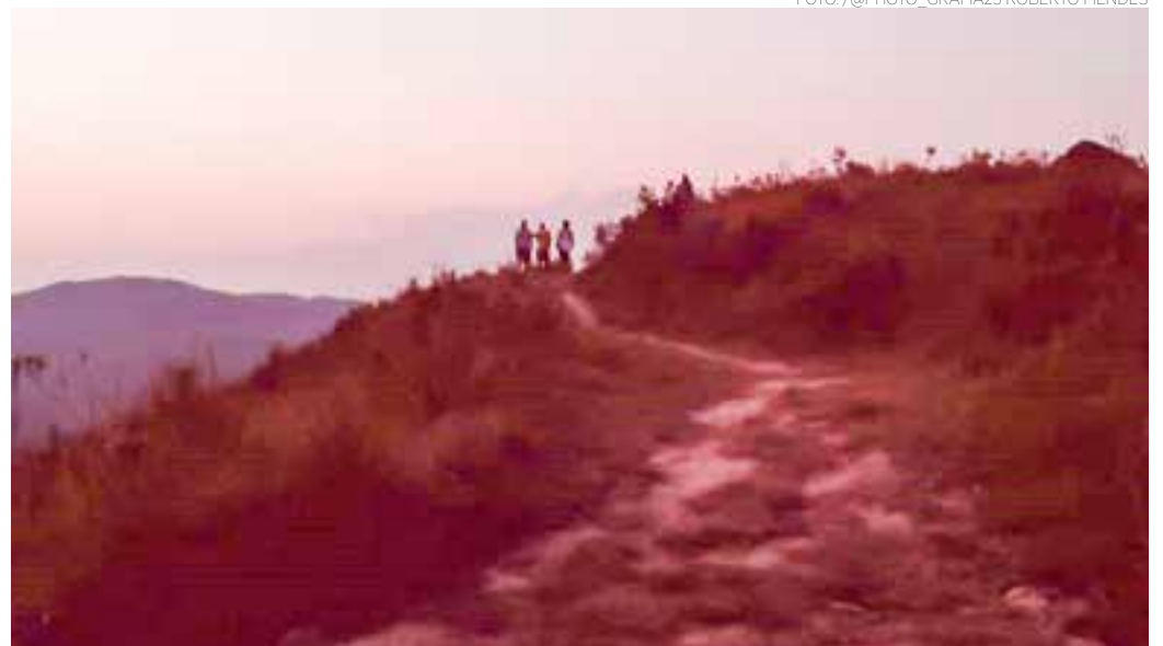
PAISAGEM - Vista do Mirante do Nhangucu, na região do Água Azul, que é um dos pontos mais altos de Guarulhos