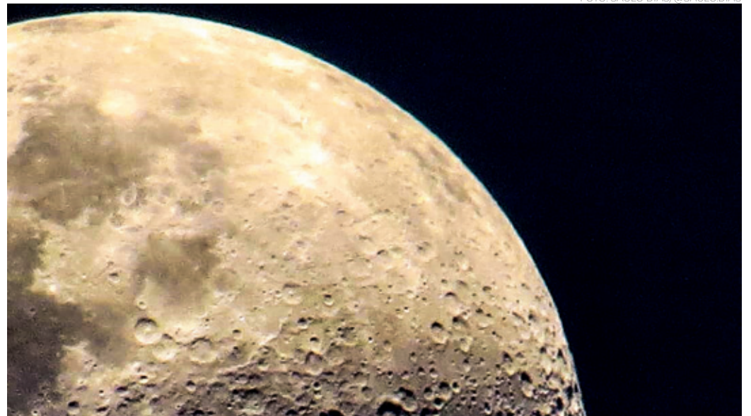
LUA - E aos poucos a Nasa vai divulgando o seu plano de novamente levar o homem à Lua