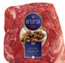
Acém Bovino Reserva kg