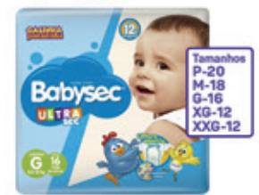
Fralda Babysec Ultra Sec Jumbinho