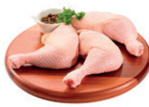
Coxa com Sobrecoxa de Frango kg