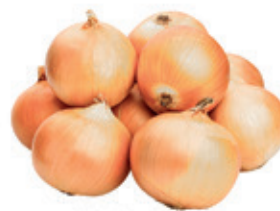
Cebola Nacional kg