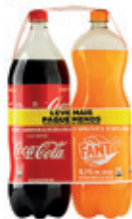
Refrigerante Coca-Cola + Fanta Sabores 2 L