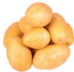
Batata Lavada kg