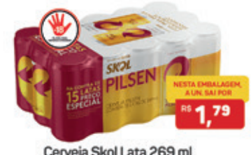
Cerveja Skol Lata 269 ml Pack com 15 un.