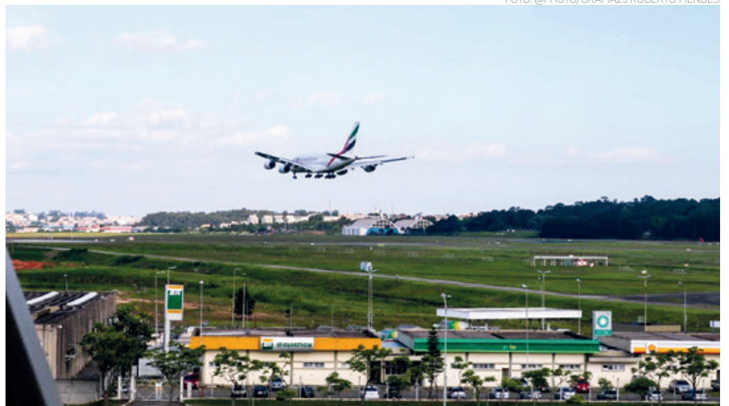
AVIÃO - Com o maior aeroporto da América Latina, em Guarulhos os aviões tocam o céu