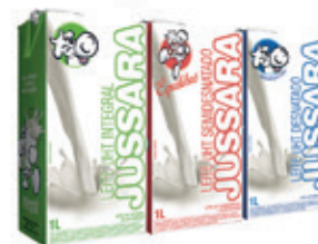
Leite Longa Vida Jussara MID 1 L (Integral / Semi / Desnatado)