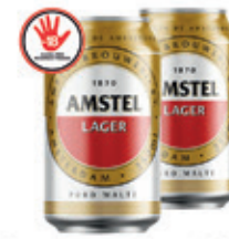
Cerveja Amstel Lata 350 ml