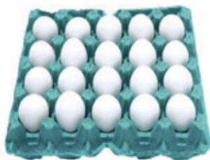
Ovo Branco Grande Bandeja 20 un.