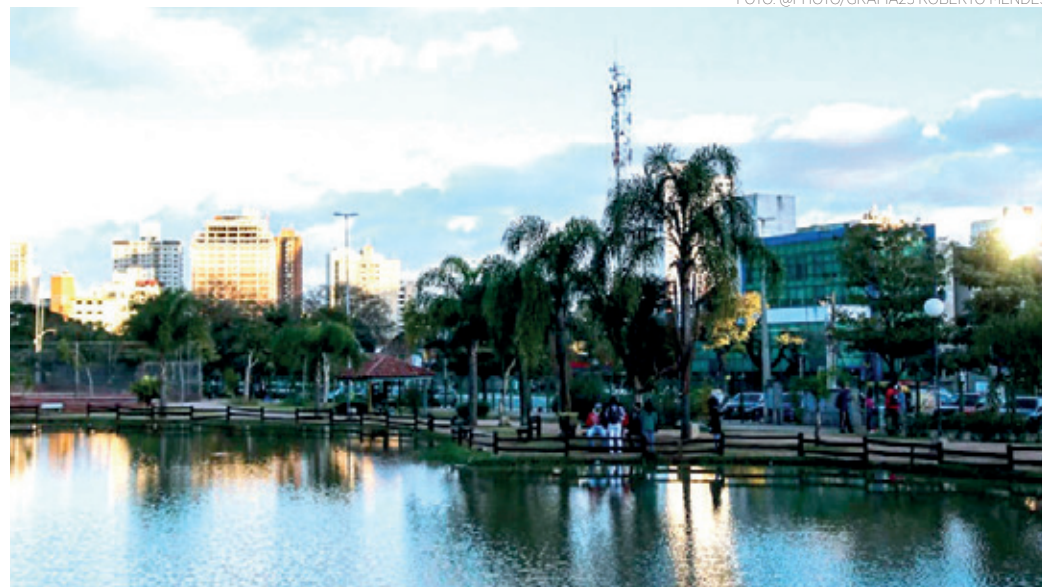
VERDE - Vista de uma das áreas verdes mais importantes de Guarulhos: o Bosque Maia