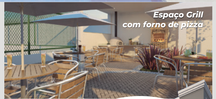
Espaço Grill com forno de pizza