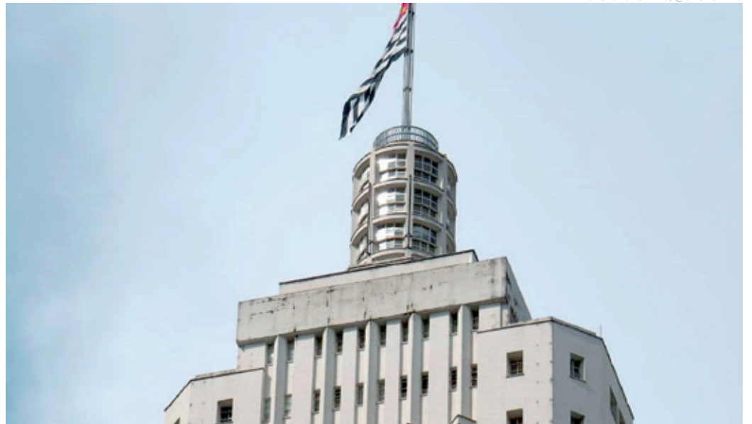
ALTURA - O Edifício Altino Arantes é o terceiro arranha-céu mais alto da capital e o sétimo mais alto do Brasil