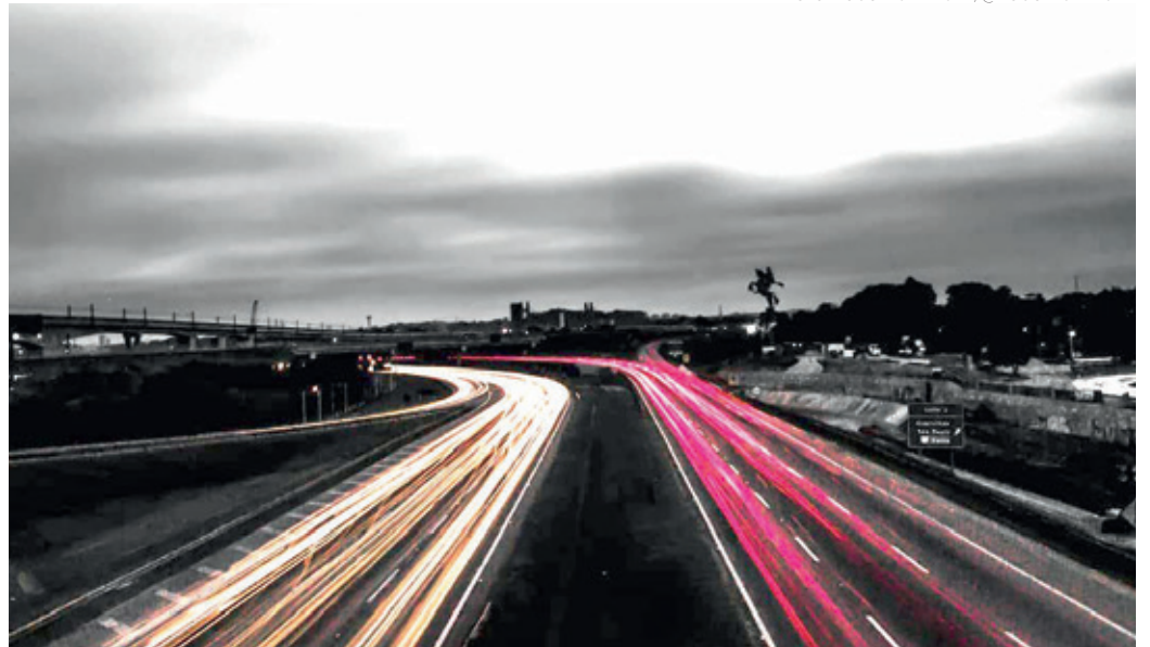
LUZES - A iluminação das grandes cidades que não param e não dormem em meio ao cotidiano