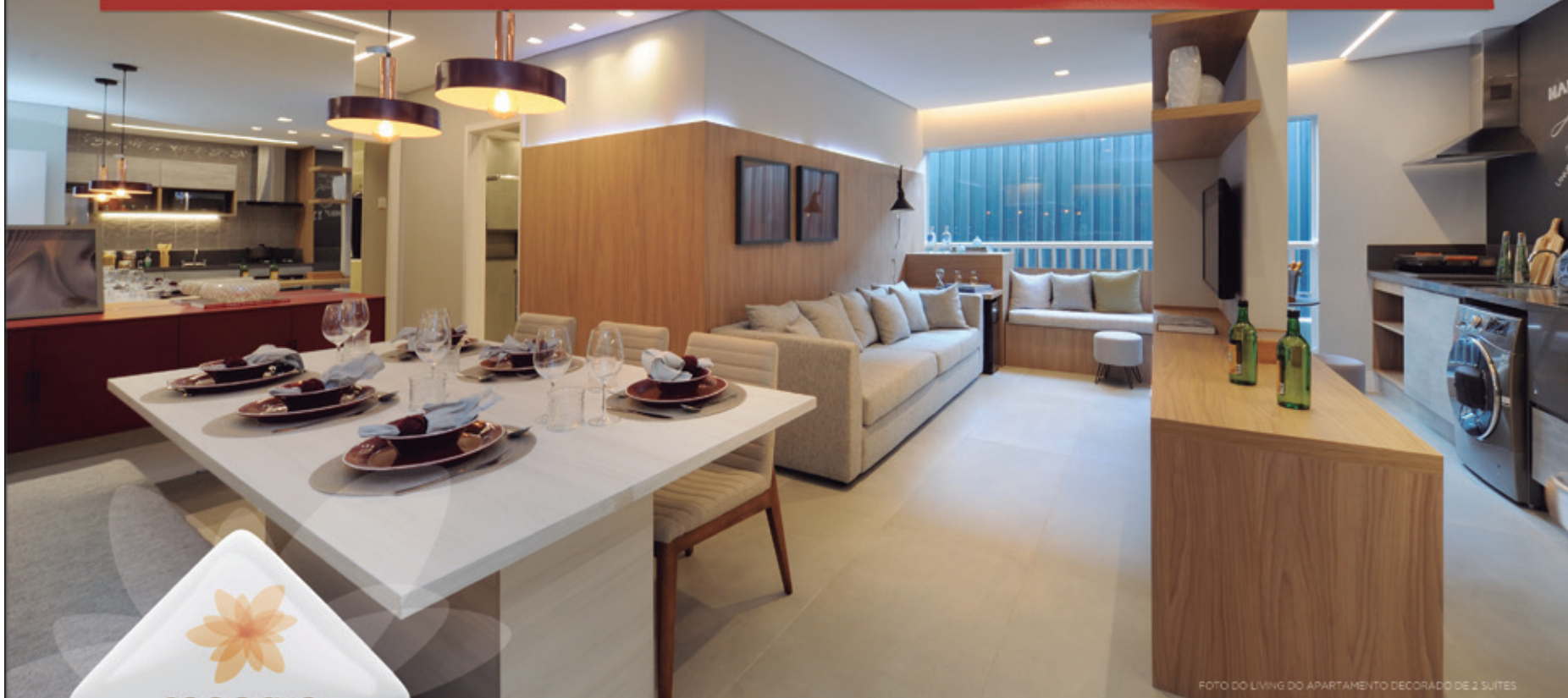
FOTO DO LIVING DO APARTAMENTO DECORADO DE 2 SUÍTES