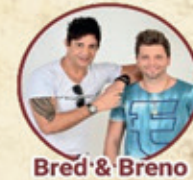
Bred & Breno