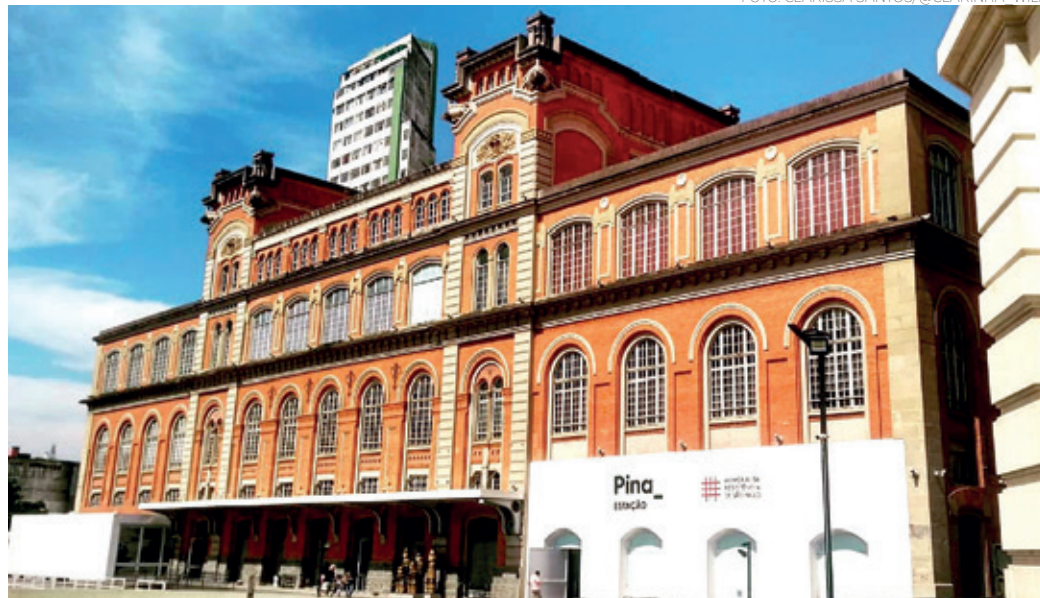
ARTE - A Pinacoteca do Estado de São Paulo é um dos mais importantes museus de arte do Brasil