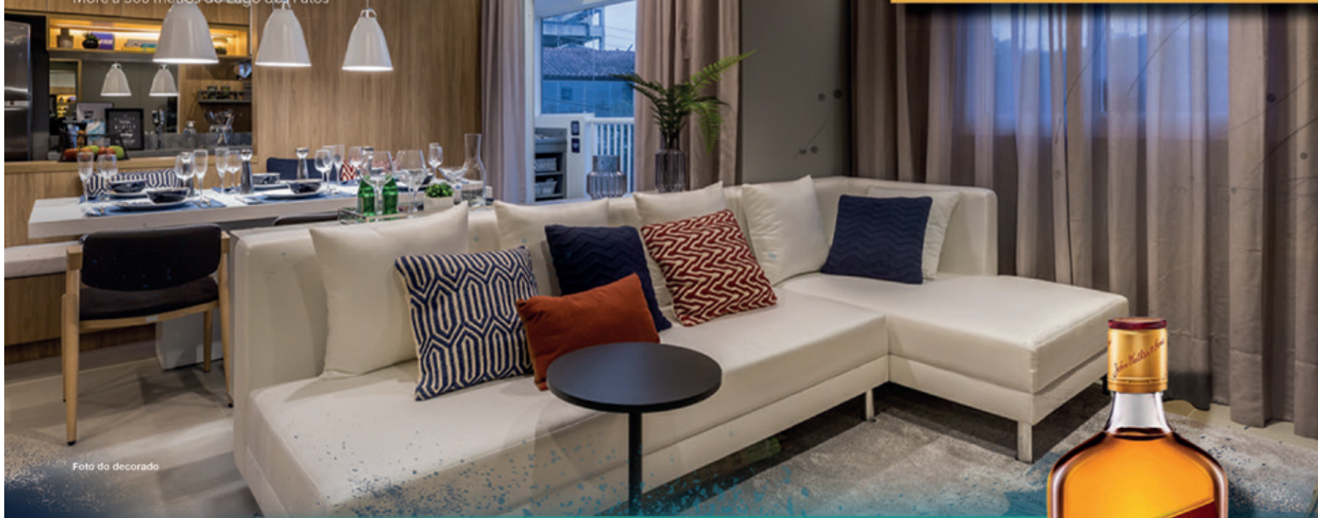
Foto do decorado

2 DORMS. 1 SUÍTE TERRAÇO GOURMET | 1 VAGA