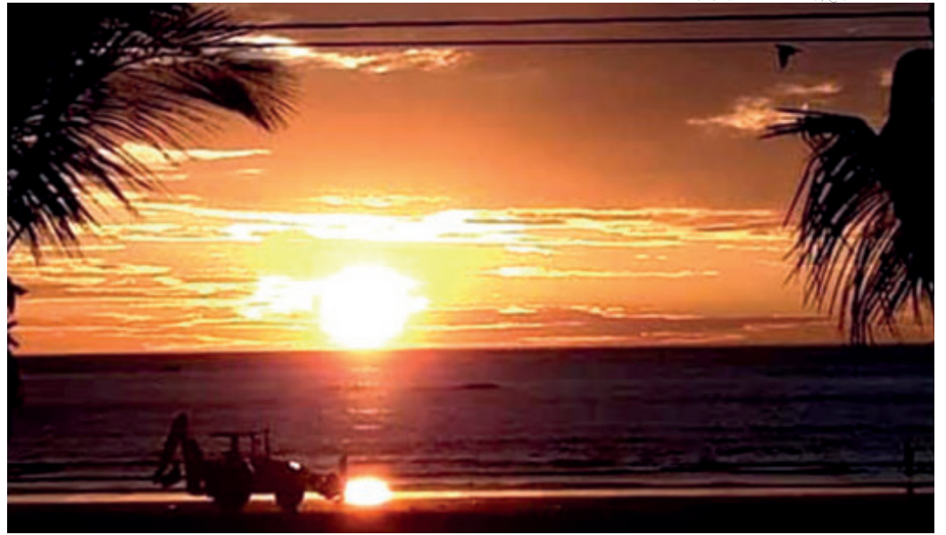
PRAIA - Um belo entardecer na Enseada de Bertioga realçando as belezas naturais que tanto atraem turistas