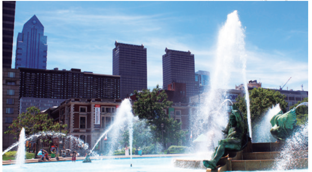
TURISMO - Belíssima fonte de água atrai turistas ao estado da Pensilvânia nos Estados Unidos