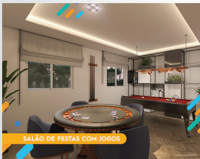
SALÃO DE FESTAS COM JOGOS