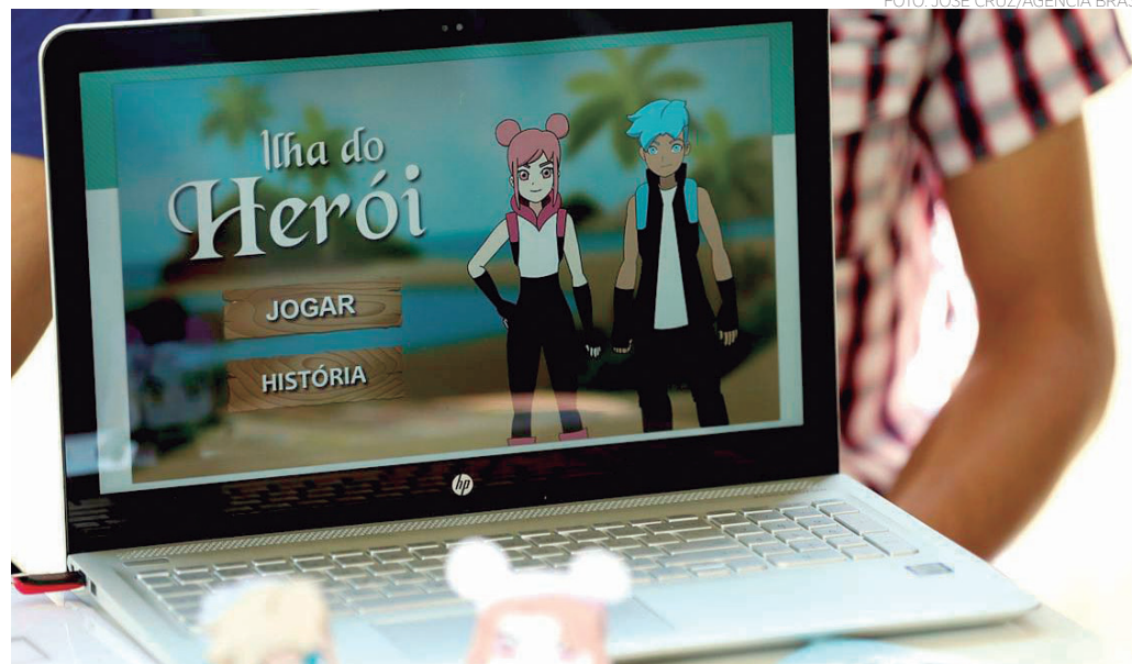
SAÚDE - A Abrace, em parceria com o Centro Universitário do DF, lança jogos para divertir e conscientiza crianças com câncer