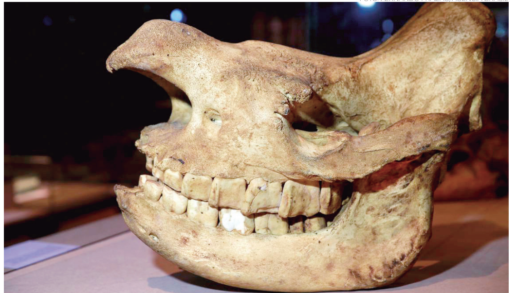
HISTÓRIA - Crânio de rinoceronte-negro na exposição Museu Nacional Vive - Arqueologia do Resgate