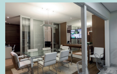
Foto da sala comercial de 75 m 2