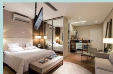
Foto do studio de 37 m 2

SALAS COMERCIAIS 31, 37 ou 49 M 2 – 1 VAGA CONJUNTOS DE ATÉ 854 M 2