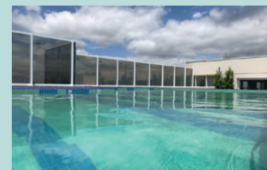
Foto da piscina