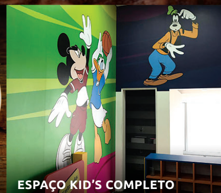
ESPAÇO KID'S COMPLETO

A melhor opção para o seu almoço de domingo!