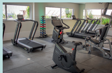
Foto do espaço fitness