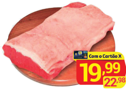
Contrafilé Peça à Vácuo Kg

Jornal válido para as lojas 1,2,3,4,5,6,7,9,10. Com válida para Sexta a Terça, dias 14/12 a 18/12/2018 ou enquanto durarem os estoques, dentro da data anunciada