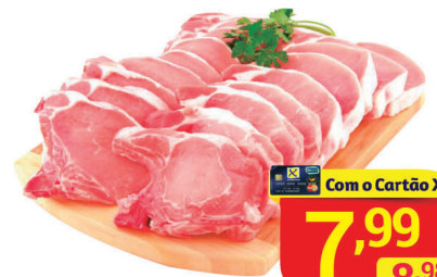
Bisteca Suína Kg