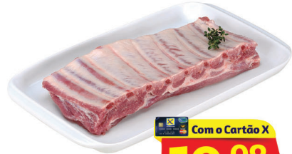
Costela Congelada Suína Kg