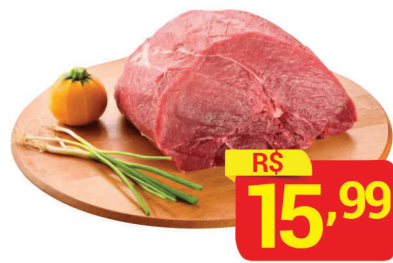
Patinho Bovino Peça à Vácuo Kg