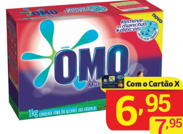
Sabão em Pó Omo MultiAção 1Kg