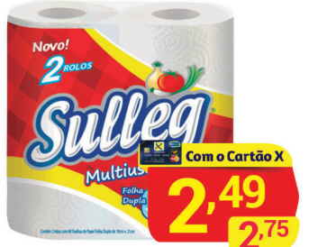
Toalho de Papel Sulleg c/2 Unid. 120F