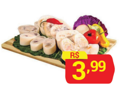
Mocotó Bovino Kg